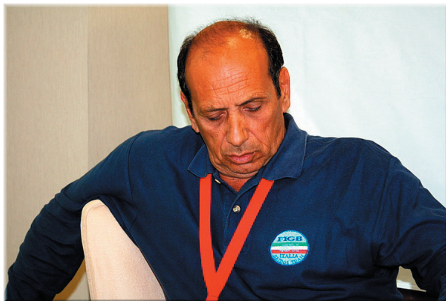
Lorenzo Lauria - stígahesti spilara heims og elstur liðsmanna hinnar nýbláu sveitar, sextugur að aldri. Lauria er maður tveggja tíma, vann sinn fyrsta EM titil 1979 í liði með Belladonna og Garozzo. Næsti EM-titill kom 1995, en Ítalar hafa unnið öll mót síðan þá - hið sjöuna í röð nú í Varsjá.