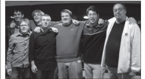
Heimsmeistarar í ungmennaflokki.

Ósvífið bragð, sem erfitt er að verjast og vestur verður ekki hart dæmdur fyrir að dúkka. En Grue fær fyrstu einkunn, bæði fyrir að lesa doblíð og eins að hafa kjark til að spila eftir sannfæringunni og hætta á tvo niður í leiðinni (ef vestur drepur á drottningu, fær hann líka stungu).